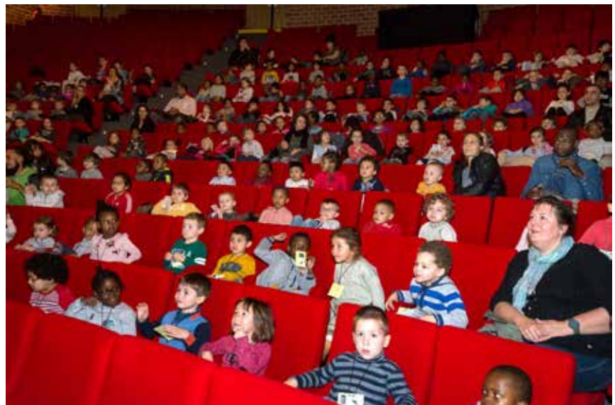
En avril, 1 800 élèves de maternelle ont assisté à l'Espace Michel-Simon à une représentation de La Pluie des mots , un spectacle de théâtre d'ombres.