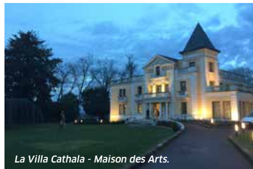
La Villa Cathala - Maison des Arts.

M. M. : Ce magnifique bâtiment manquait d'identité et était mal connu des Noiséens. Nous avons donné à la « Maison des Arts » une nouvelle vie. Elle accueille désormais des spectacles adaptés à cet écrin architectural : opéras d'appartement, chansons, cabarets lectures... Mais aussi des expositions mettant à l'honneur des cultures étrangères : cette année des artistes de Bulgarie, l'an prochain de la République dominicaine... La villa sert aussi de tremplin : l'exposition sur l'Art africain, en octobre 2016, a permis aux artistes d'exposer dans de nombreux lieux.